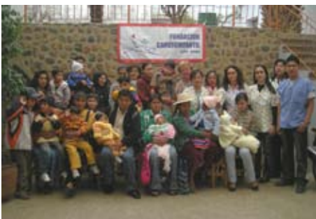
Eine Gruppe Patienten aus dem Hochland