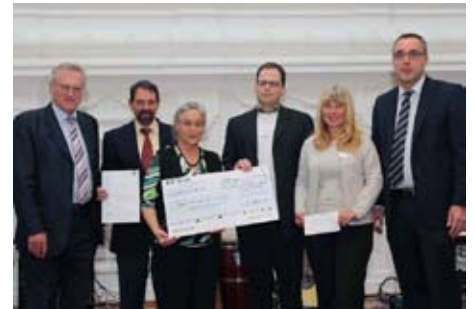
Preisverleihung des Eine-Welt-Preises Baden-Württemberg im Neuen Schloss am 13.11.10