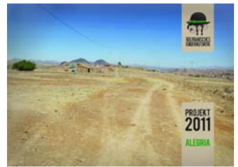
Der Ort an dem die neue Kindertagesstätte in Alegria entstehen wird