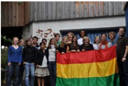
Vorbereitungseminar in Salzgitter

Während viele Freiwillige beim ersten Gespräch noch eher schüchtern wirken, ändert sich das sehr schnell. Durch den Freiwilligendienst gereift, kommen sie mit neuen Erfahrungen als selbstbewußte Persönlichkeiten wieder zurück und wollen sich weiter engagieren für eine Welt, die jeden Tag ein bisschen gerechter wird. Sehr gerne erinnere ich mich an ein Bewerbungsgespräch mit einer Freiwilligen im Frühjahr 2010. Etwas schüchtern, aber überzeugt von ihrem Vorhaben nach Bolivien zu gehen, erzählte sie uns über sich. Sie wollte in jedem Fall nach Bolivien gehen, obwohl ihre alleinerziehende Mutter nichts von der Idee ihrer Tochter hielt. Ein gutes halbes Jahr später treffe ich bei der Verabschiedung am Flughafen das erste Mal ihre Mutter, die mir mit leuchtenden Augen erzählt, wie sich ihre Tochter in letzter Zeit entwickelt hat und