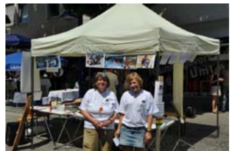
Der BKHW-Stand auf dem Höflesmarkt in Stuttgart-Feuerbach am 3.7.2010