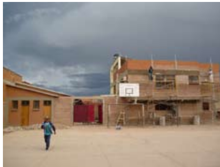
Der Bau der Kindertagesstätte in Villa Armonía B kurz vor dem Abschluss

* Als positiv sehen wir auch das gute Verhältnis von einheimischen Mitarbeitern und internationalen Freiwilligen an. Demokratische Verhaltensweisen werden durch zahlreiche Information, Aussprachen, Absprachen, Diskussionsrunden und gemeinsame Übereinkünfte, auch gemeinsame Feste und Ausflüge mit gutem Erfolg geübt.