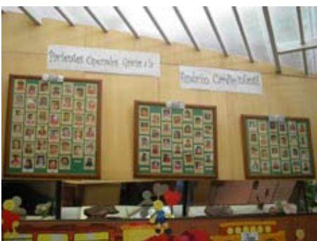
Bilder der operierten Patienten im Kardiozentrum

Diese wiederum können wir nur leisten dank verschiedener grosszügiger Spenderinnen und Spender weltweit, die dafür sorgen, dass sich die Versorgung der herzkranken Kinder in Bolivien nicht nach ihrem Geldbeutel, sondern nach ihren Bedürfnissen richtet!