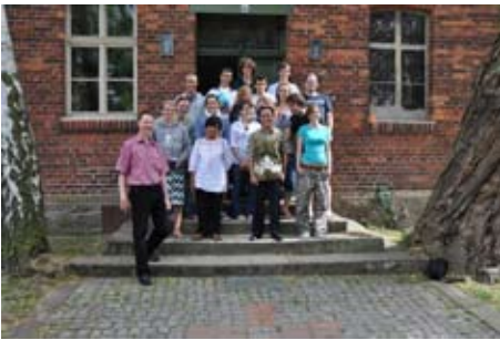
Vorbereitungseminar Klöden (Sachsen-Anhalt)

Was mich in diesem Jahr wieder begeistert hat war, wie sehr unsere Freiwilligen auf ihren Einsatz in Bolivien "brannten" und es kaum mehr erwarten konnten, auszufliegen, um sich dort zu engagieren. Mit ihrer Motivation steckten sie ihre Familie, Freunde, Bekannte und viele Spender an. Konzerte wurden gegeben, Unternehmen angeschrieben, auf der Straße musiziert, um nur einige Beispiele zu nennen. Zeitungsartikel sind in vielen Teilen Deutschlands über das BKHW und unsere Arbeit in Bolivien erschienen und sogar im Online-Wirtschaftsnetzwerk XING habe ich erst kürzlich eine Nachricht einer unserer Freiwilligen gelesen, die in Emails um Unterstützer für ihren Aufenthalt warb, der so wichtig für sie war (und sicherlich noch ist).